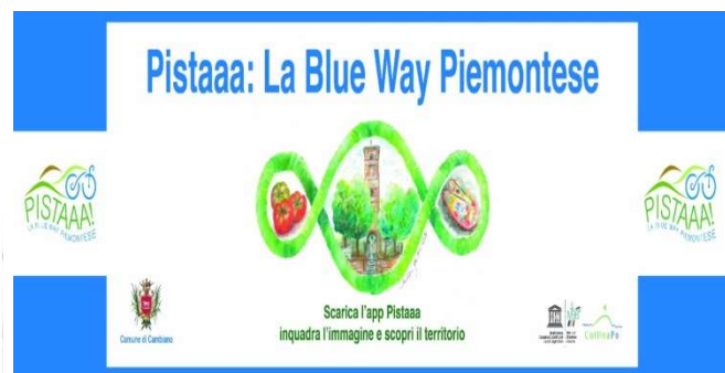
Esempio di indicazioni stradali di Pistaaa : cartello dell'itinerario Cambiano - Pecetto T.se

Non solo si intende fare rete con agricoltori, artigiani, artisti, lavoratori dell'accoglienza, ma anche con le università (Università di Torino, Master MaSRA, il Politecnico di Torino), enti locali, associazioni e comunità. Soprattutto, si vuole creare e formare il senso dell'identità del territorio nei giovani perché solo in questo modo li si potrà riattrarre nelle aree rurali.