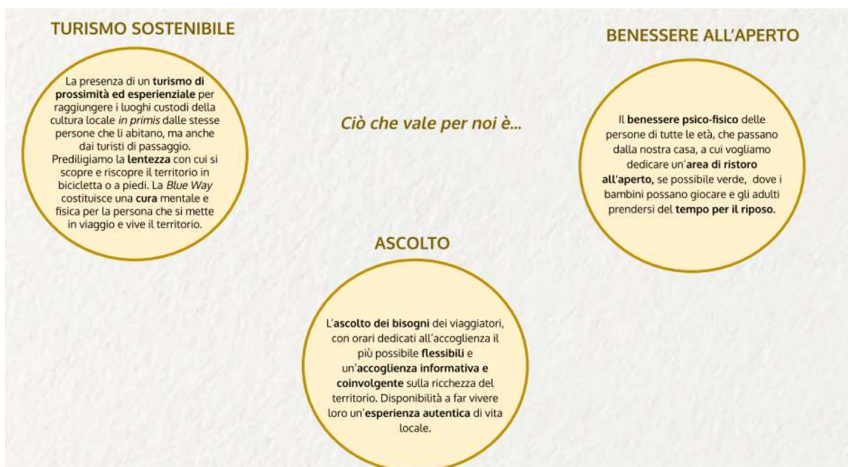
Manifesto dell'Ospitalità, Valori (seconda parte)

Per Solidarietà e Cooperazione si è voluto intendere il desiderio di condividere la salvaguardia del benessere delle persone e della terra, attraverso uno sforzo comune e coordinato, volto alla realizzazione di buone pratiche. Si intende valorizzare il territorio, con