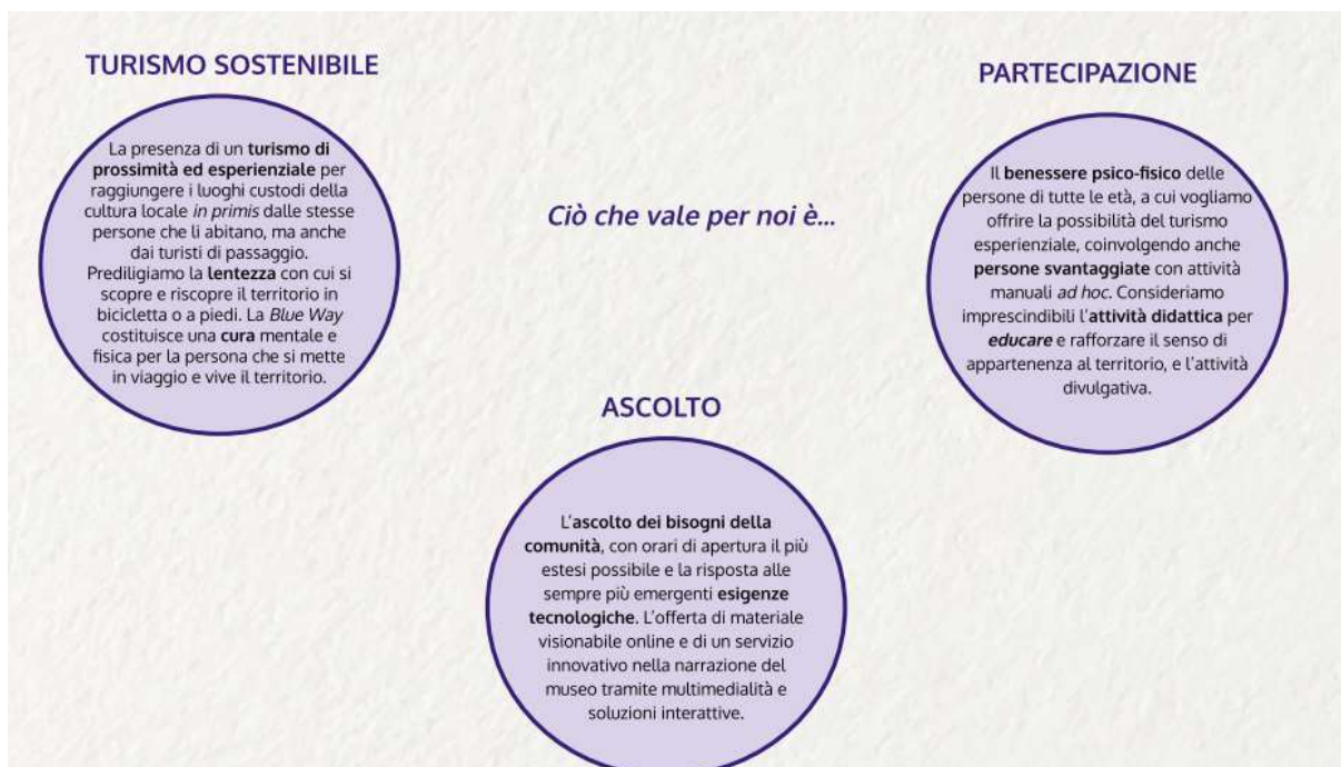
Manifesto dei Musei, Valori (seconda parte)

Per Identità territoriale si è voluto intendere il desiderio di prendersi cura e valorizzare un bene comune nell'ambito artistico, storico e culturale, che è patrimonio di tutti e che i musei partecipanti, in quanto tali, possono promuovere in maniera maggiore, facendo scaturire