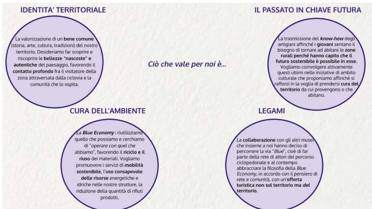
Manifesto dei Musei, Valori (prima parte)