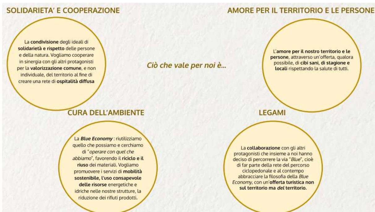
Manifesto dell'Ospitalità, Valori (prima parte)