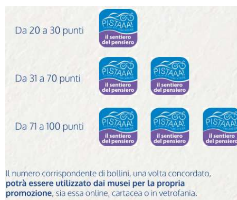
Bollini dei Musei